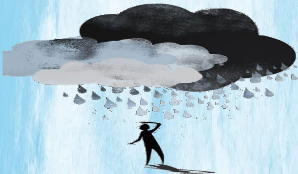
Slika 1. Depresija, ilustracija

Umor i gubitak koncentracije su česti simptomi kod uremičnih i depresivnih bolesnika. Njihova jasna diferencijacija može pomoći u liječenju jednog broja bolesnika.